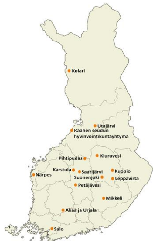
Kuvio 1. Vuonna 2016 Voimaa vanhuuteen -ohjelmaan valitut kunnat